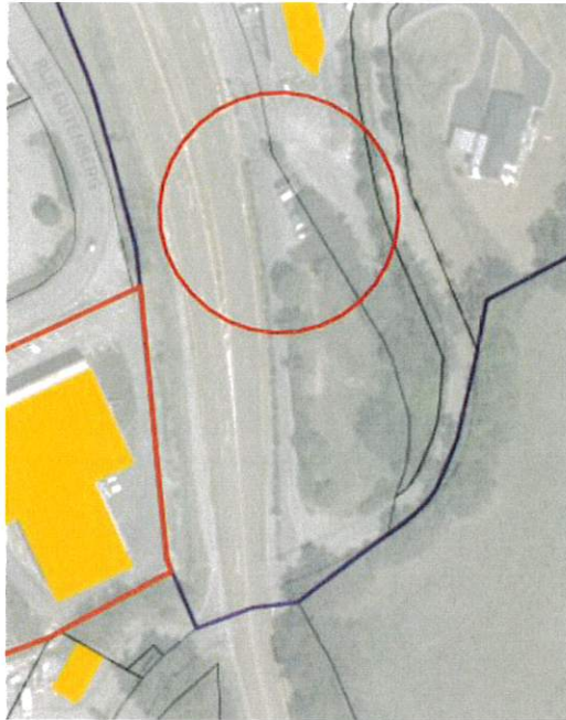
Schéma de signalisation