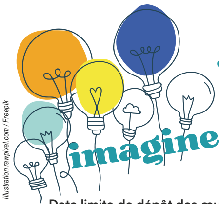
illustration rawpixel.com / Freepik

Les Jeux Olympiques et Paralympiques inspirent la créativité de nos petits écoliers.